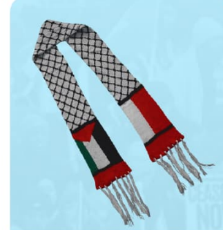
Syal Rajut Palestina

Dapatkan Produk ODOJ edisi khusus Palestina serta beragam merchandise lainnya hanya di: