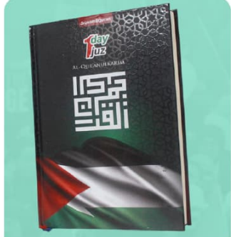
Al-Qur'an A5 ed. Palestina